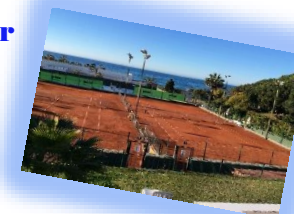
Hotel Don Carlos 5*****